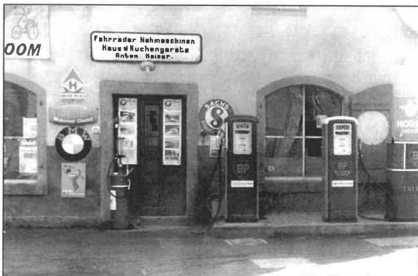
Ab dem Jahr 1958 gab es zwei Zapfsäulen für Normal- und Superbenzin mit Elektropumpen. Das Kleinabgabegerät links musste extra genehmigt werden und wurde im Jahr 1959 aufgestellt.