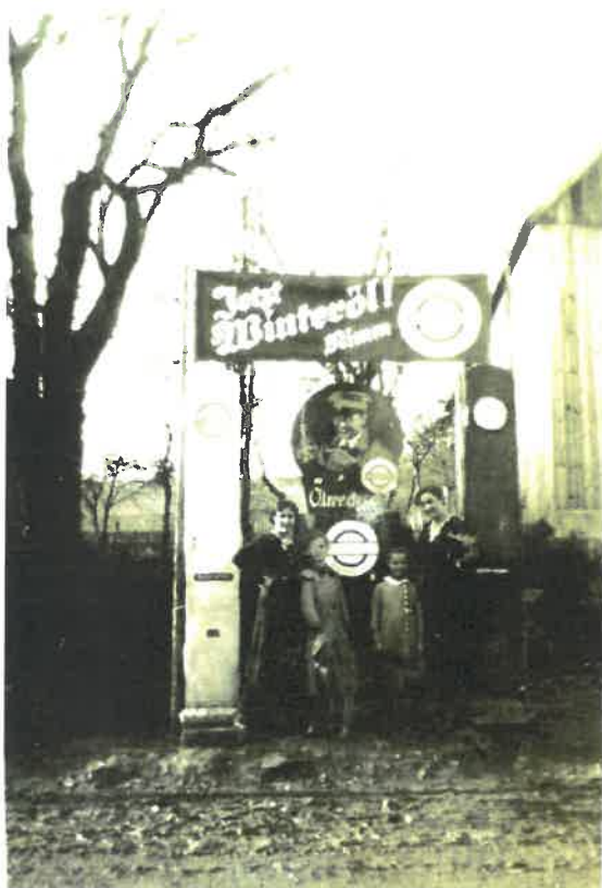
Die erste „Benzintankanlage“ in der Pfarrei Burkardroth ging im Jahre 1927 in der Forstmeisterstraße in Zahlbach in Betrieb.