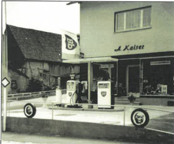
Am 8. Dezember 1966 ging die neue Tankstelle in der Oberen Marktstraße in Betrieb