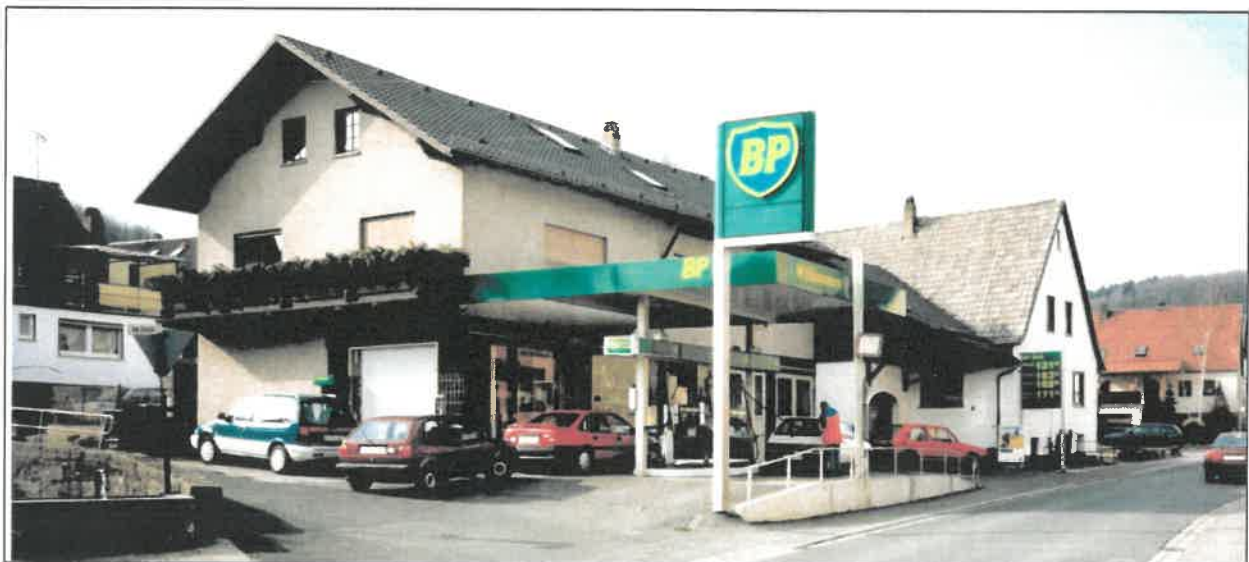
Die Tankstelle Kaiser in der Oberen Marktstraße kurz vor dem Umzug im Juli 1997

Im Mai 1988 erkannte man die American Expresskarte an, ab Januar 1989 Gewerbliche Flottenkarten, im Laufe des Jahres 1989 kamen weitere Kreditkarten dazu und schließlich ab Oktober 1990 electronic-cash mit Akzeptanz der ec-Karte.