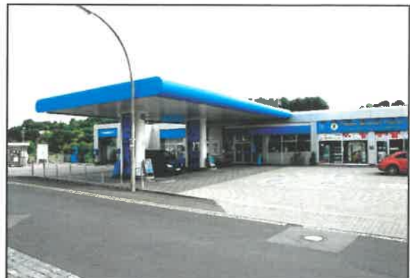
Neue BP-Tankstelle in Zahlbach, Eröffnung am 26.07.1997 Umstellung von BP auf Aral im Mai 2003

Nach Umbau des Autohauses Kaiser von Mai bis Juli 1997 entstand nun auf dem Gelände eine alle Auflagen der Umweltschutzbehörde erfüllende, moderne BP-Tankstellenanlage mit großem Verkaufsshop und einer Autowaschanlage.